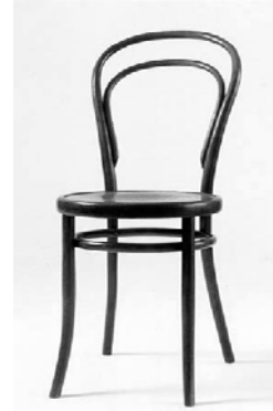
2. Designer : Michael Thonet