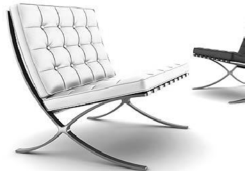
4. Designer : Ludwig Mies van der Rohe