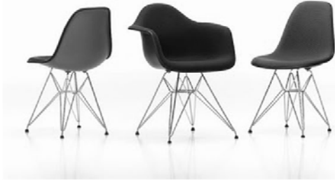
1. Designer : Charles & Ray Eames