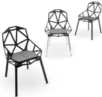
3. Designer : Konstantin Grcic